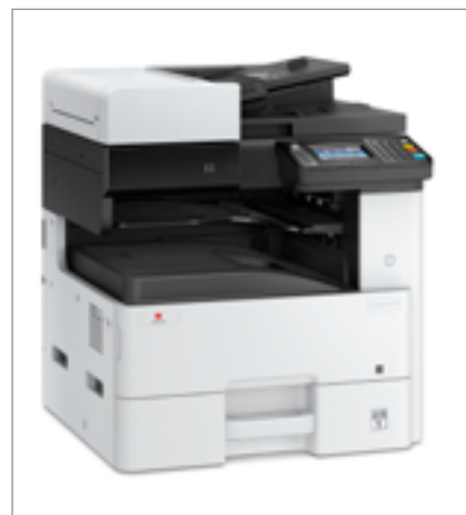
d-Copia 255MF in configurazione base