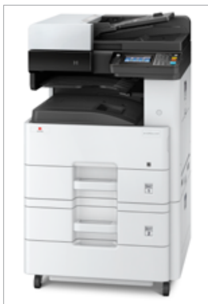
d-Copia 255MF con cassetto opzionale PF-470